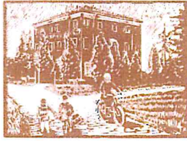
e palaz ad Panòcia (palazzo Monsignani)

Comitato di Quartiere di Pievequinta-Caserma-Casemurate